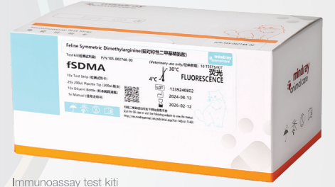
Immunoassay test kiti